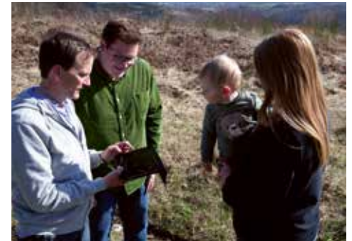
Ortstermin im neuen Baugebiet in Windhausen.

Im Wahlbezirk 14 geht was – und noch mehr ist möglich. Wer Ideen hat oder Anregungen einbringen möchte, ist herzlich eingeladen, sich zu melden. Denn gute Kommunalpolitik lebt vom Mitmachen. Wir kümmern uns!