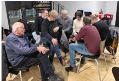
Bürger und Politiker im Dialog über den Haushalt

der Realität vorbei. Da sprach wohl eher die Geschäftsführerin der Kreis-CDU als eine Vertreterin Attendorner Interessen. Eine Beißhemmung gegenüber Parteifreunden, die in Bund, Land oder Kreis in Verantwortung stehen, ist jetzt fehl am Platz.